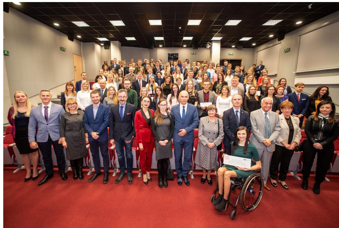
Zdjęcie: Uroczyste rozdanie stypendiów Młodzi w Łodzi 2018

Ogłoszenie listy laureatów programu stażowego nastąpi 14 czerwca 2019 r.