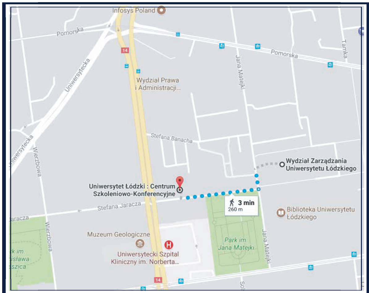
OKOLICE WYDZIAŁU ZARZĄDZANIA UŁ