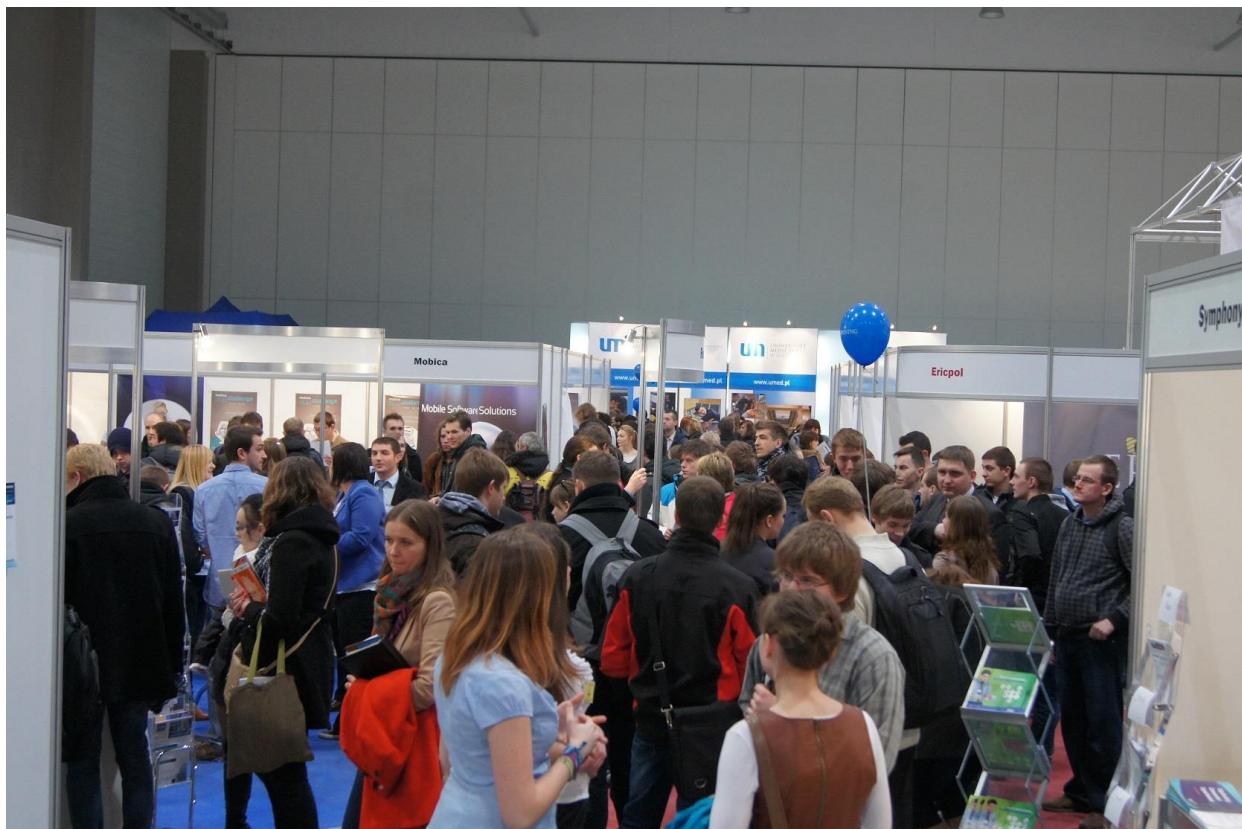
Widok hali wystawowej podczas ATP 2014