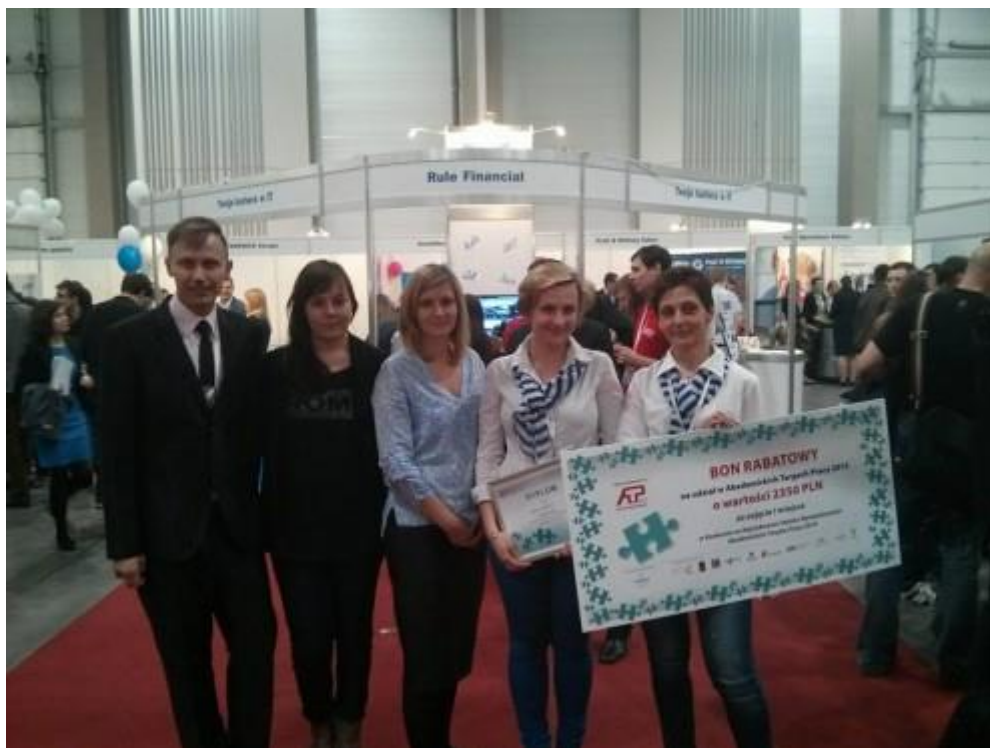
Laureatki Konkursu na najciekawsze stoisko wystawiennicze Akademickich Targów Pracy 2014

Szczegóły konkursu oraz regulamin uczestnictwa przedstawione zostaną po zgłoszeniu się wystawcy do udziału w ATP 2015.