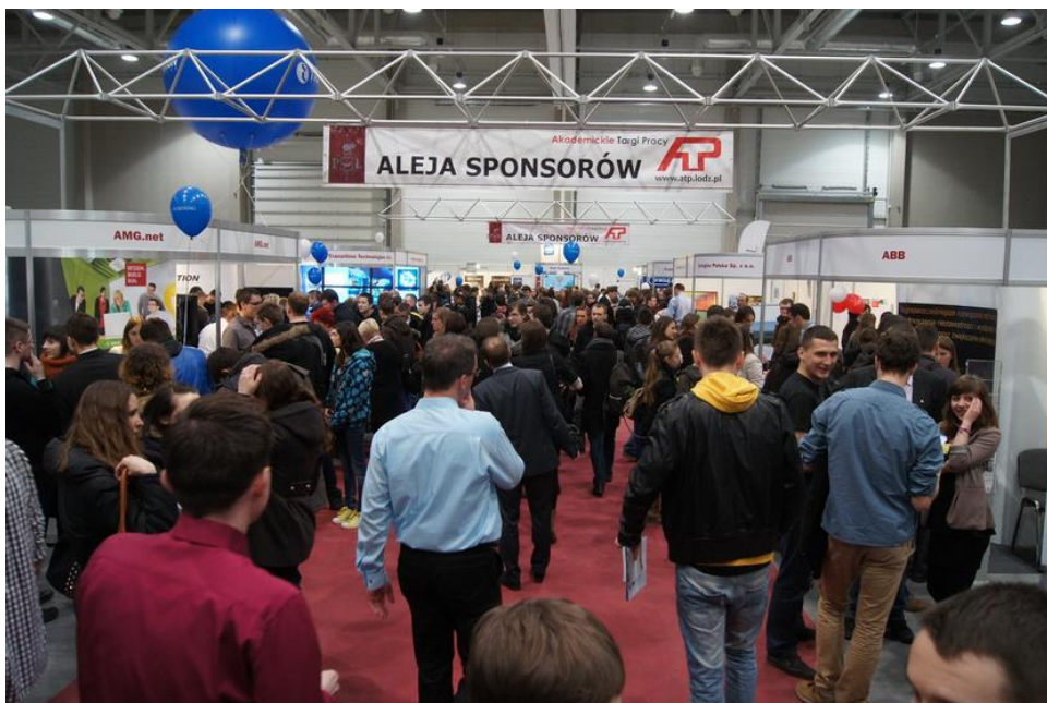
Widok hali wystawowej podczas ATP 2013

Akademickie Targi Pracy (ATP) to cykliczna impreza, która w roku 2015 organizowana jest już po raz dziesiąty. Jubileuszowa edycja odbędzie się 21 kwietnia 2015 roku i tradycyjnie skierowana jest do studentów i absolwentów łódzkich uczelni wyższych oraz firm poszukujących młodych pracowników. Głównym celem targów jest ułatwienie kontaktu pomiędzy studentami, a przedstawicielami firm. ATP odbywają się w hali Expo-Łódź Sp. z o.o.