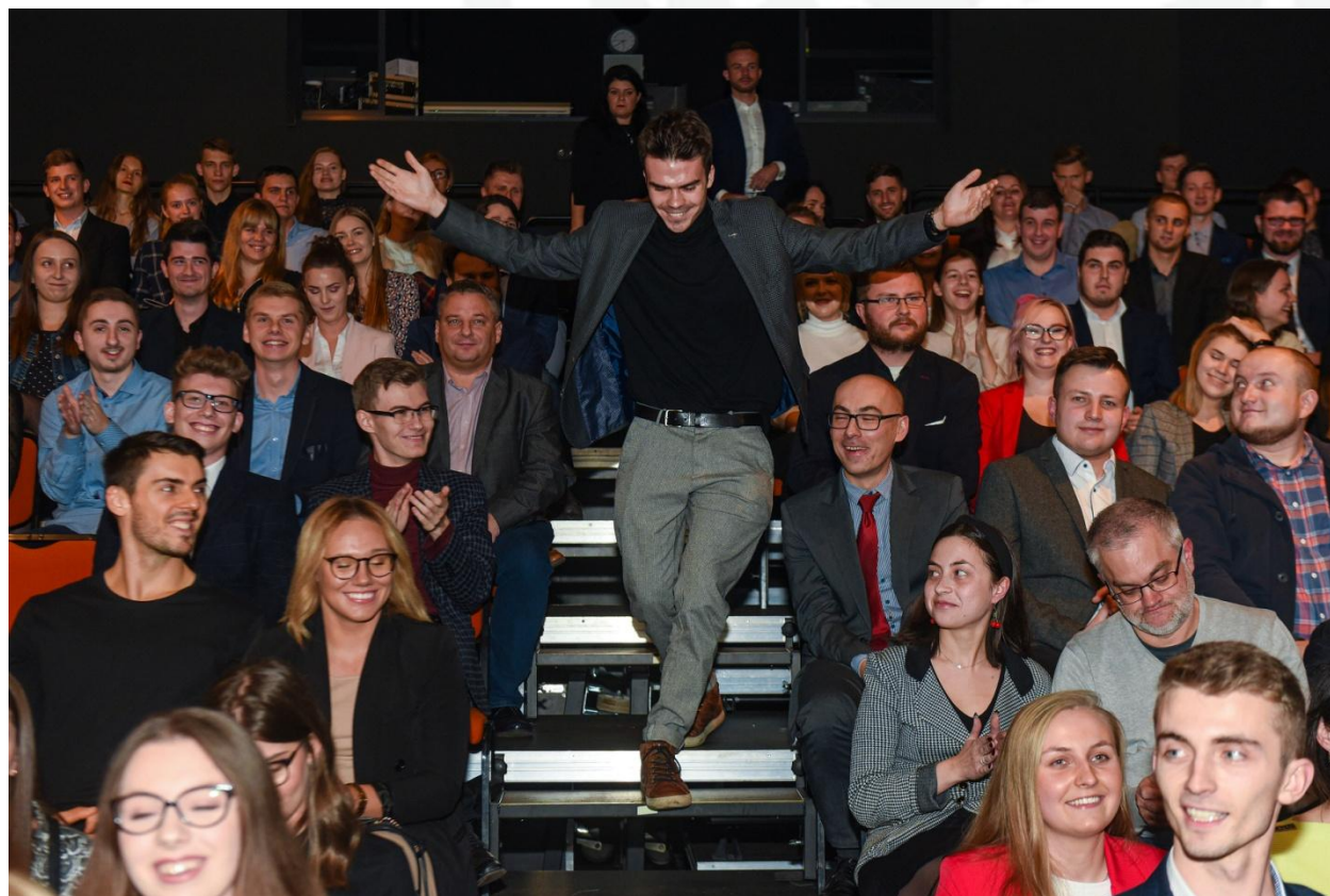
Zdjęcie: Uroczyste rozdanie stypendiów Młodzi w Łodzi 2019

Ogłoszenie listy laureatów programu stażowego nastąpi 15 czerwca 2020 r.